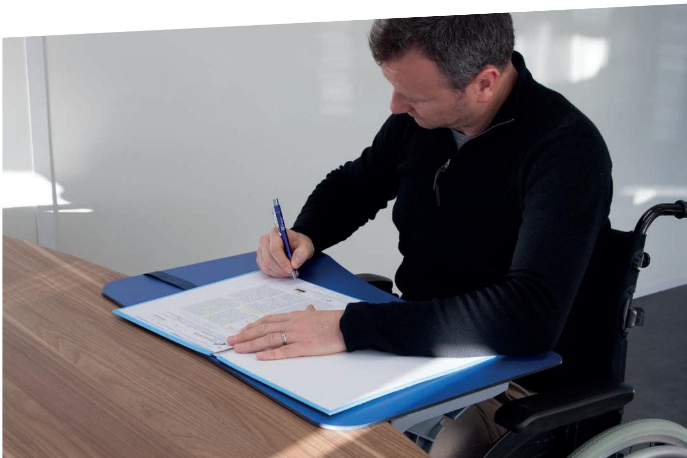
TABLA PORTÁTIL JUMBOREST ACCESS

La tabla portátil se puede colocar en mesas de escritorio para proporcionar un espacio de trabajo funcional para personas con necesidad adicional de espacio.